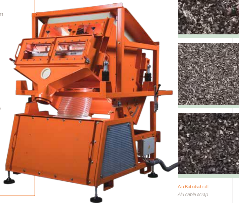
Alu Kabelschrott Alu cable scrap